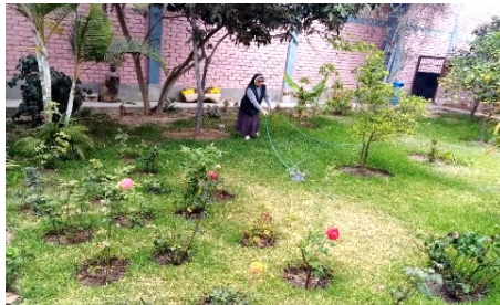
Cuidando la tierra. Perú 2022