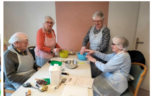
Educación para un estilo de vida sostenible Taller de cocina con productos locales. (arriba) Enseñando jardinería a niños izquierda) Vendôme, Francia 2023