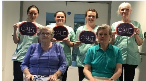
Abordando la trata humana, Cork 2019