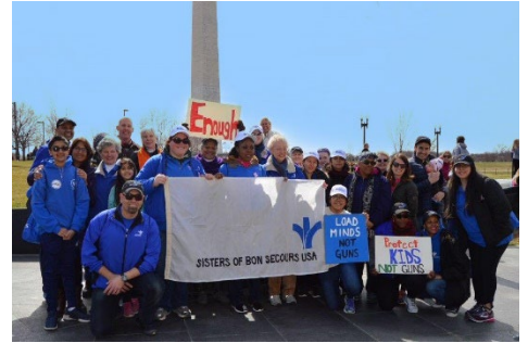
Marcha por nuestras vidas contra la violencia armada Washington, DC 2018