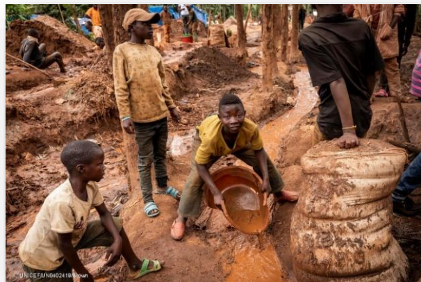
Enfants au travail dans une mine d'or en République démocratique du Congo. Les données de l'UNICEF montrent que quelque 40 000 enfants – dont beaucoup sont issus de familles déplacées – travaillent dans les mines en RDC, principalement à la recherche de cobalt pour les téléphones portables et les voitures électriques.

Les enfants sont exploités le plus souvent dans les mines artisanales et à petite échelle où ils creusent souvent à mains nues. Les mineurs artisanaux effectuent des travaux dangereux pour l'équivalent de quelques dollars par jour. Globalement, la quantité de minéraux provenant de mines artisanales et à petite échelle est considérable et s'ajoute à une offre plus importante de minéraux extraits de manière industrielle. L'Organisation internationale du travail (OIT) estime que l'exploitation minière artisanale et à petite échelle représente environ 20 pour cent de l'offre mondiale d'or, 80 pour cent de l'offre mondiale de saphir, 20 pour cent de l'offre mondiale de diamants, 15 pour cent de l'offre mondiale de cobalt et 25 pour cent de l'offre mondiale d'étain. Quelque 40 millions de personnes travaillent dans les mines artisanales et à petite échelle (chiffre qui a doublé ces dernières années d'après l'OIT) contre 7 millions dans l'exploitation minière industrielle. De ce nombre, plus d'un million sont des enfants. Cette grave violation des droits de l'enfant met en danger leur santé et leur sécurité et les prive d'éducation.