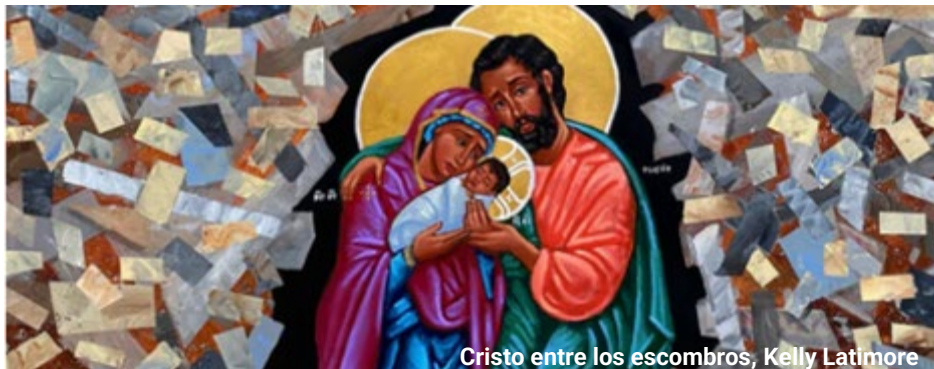
Cristo entre los escombros, Kelly Latimore

Sus primeras palabras como Papa León XIV fueron: «La paz sea con ustedes», por lo que no sorprende que su mensaje para la Jornada Mundial de la Paz de este año sea una invitación a la humanidad a rechazar la lógica de la violencia y la guerra, y a abrazar una paz auténtica basada en el amor y la justicia. Esta paz debe ser desarmada, es decir, no basada en el miedo, las amenazas ni las armas, y debe ser desarmante, capaz de resolver conflictos, abrir corazones y generar confianza mutua, empatía y esperanza.