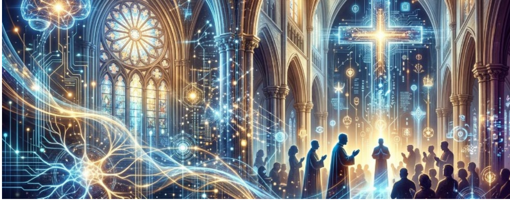
Photo générée par IA

Je m'en souviens comme si c'était hier : la fumée blanche s'échappait de la cheminée de la chapelle Sixtine. J'observais avec impatience le cardinal Robert Prevost annoncer au monde son nouveau nom, Léon XIV. Je ne connaissais pas grand-chose du cardinal Prevost à l'époque, mais je savais qu'on voit souvent son homonyme, le pape Léon XIII, comme le père de la doctrine sociale de l'Église. C'est lui qui a écrit l'encyclique Rerum Novarum (La soif d'innovations). Publié le 15 mai 1891, ce texte traitait de la situation de la classe ouvrière au moment de la première révolution industrielle, période de profonds bouleversements sociaux. Le pape Léon XIII était confronté aux bouleversements de l'ère industrielle : inégalités criantes, concentration des richesses, exploitation des travailleurs. Il a formulé des principes qui allaient fonder la doctrine sociale de l'Église : droit à la propriété privée, salaire équitable, droit au repos et protection particulière pour les plus vulnérables.